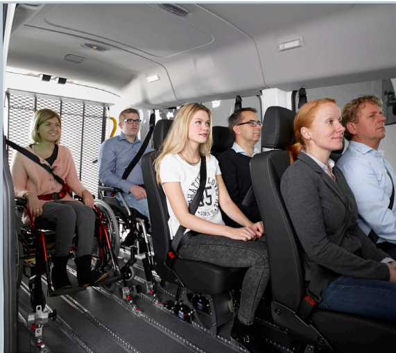
Durch den Smartfloorboden ist die flexible Beförderung von Personen mit und ohne Rollstuhl kein Problem.