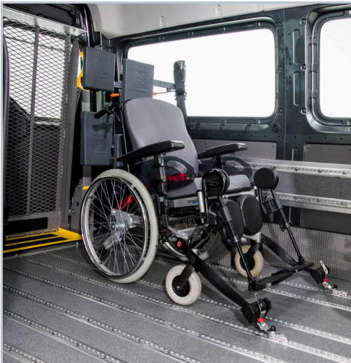
Über den Lift gelangt der Rollstuhl in das Fahrzeug; das AMF-Bruns PROTEKTOR System sichert Person und Rollstuhl.